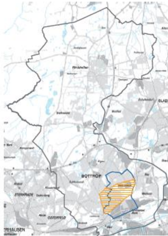
Abbildung 5: Einordnung Batenbrock Südwest