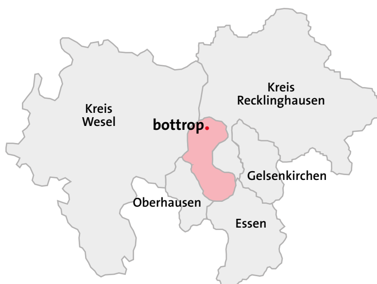
Bottrop und Umgebung

Die zweite Ziffer bezeichnet den Indikator des Themenfeldes (z. B. 02_05 ).